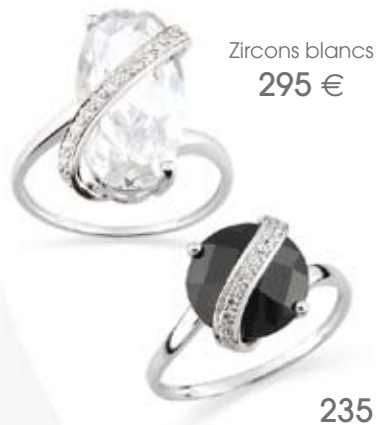
Zircons blancs 295 €